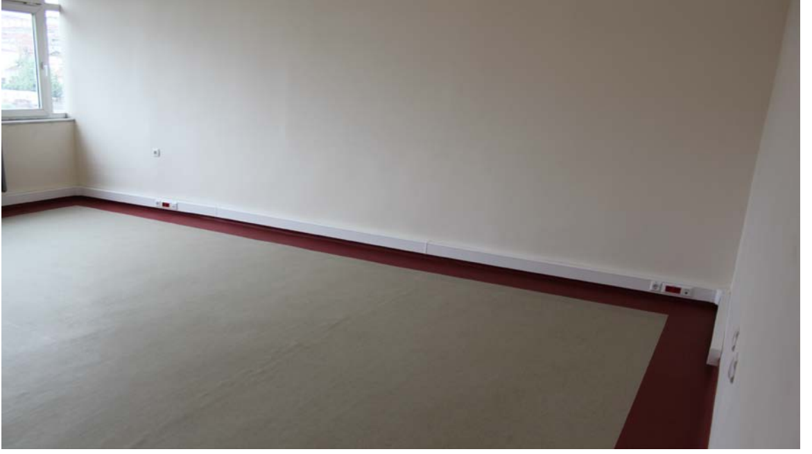
Göztepe binası yeni ek oda bölmesi yapım işi: