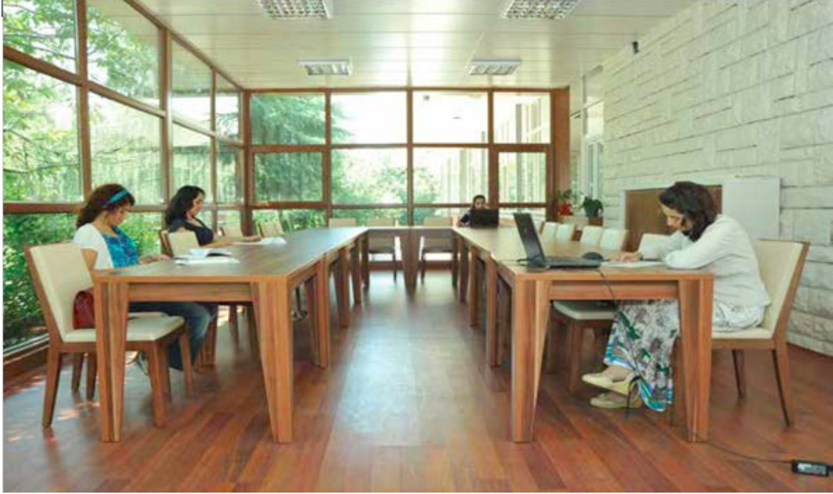
Göztepe Binası kış bahçesi tadilatı: