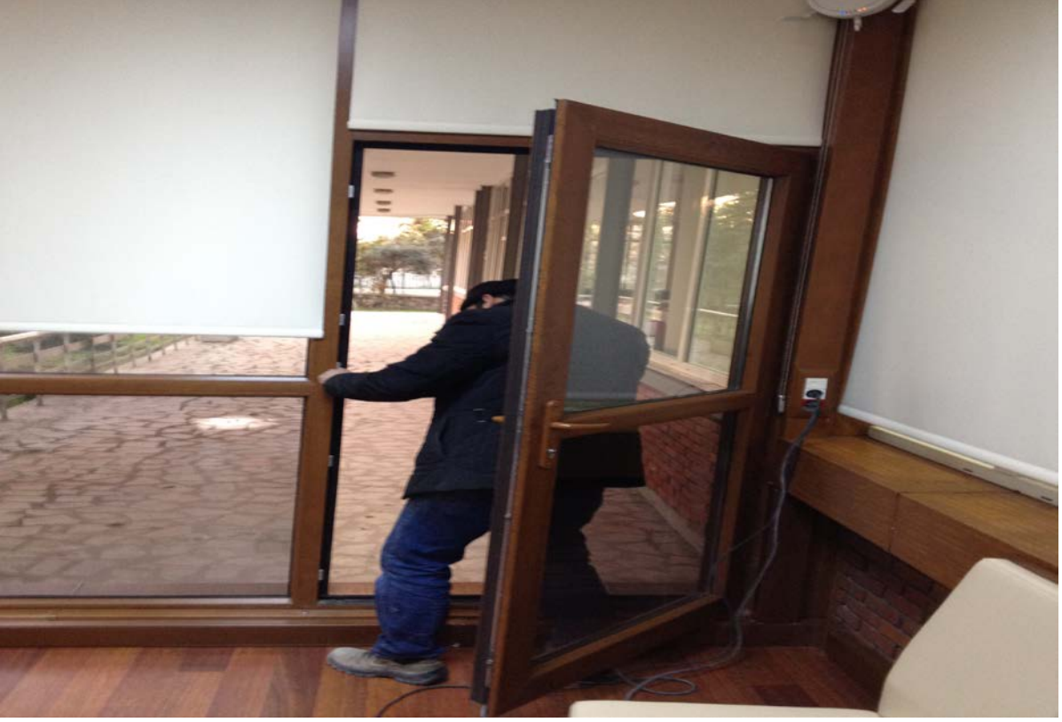
Göztepe binası kış bahçesi girişi merdiven ve korkulukları onarımı: