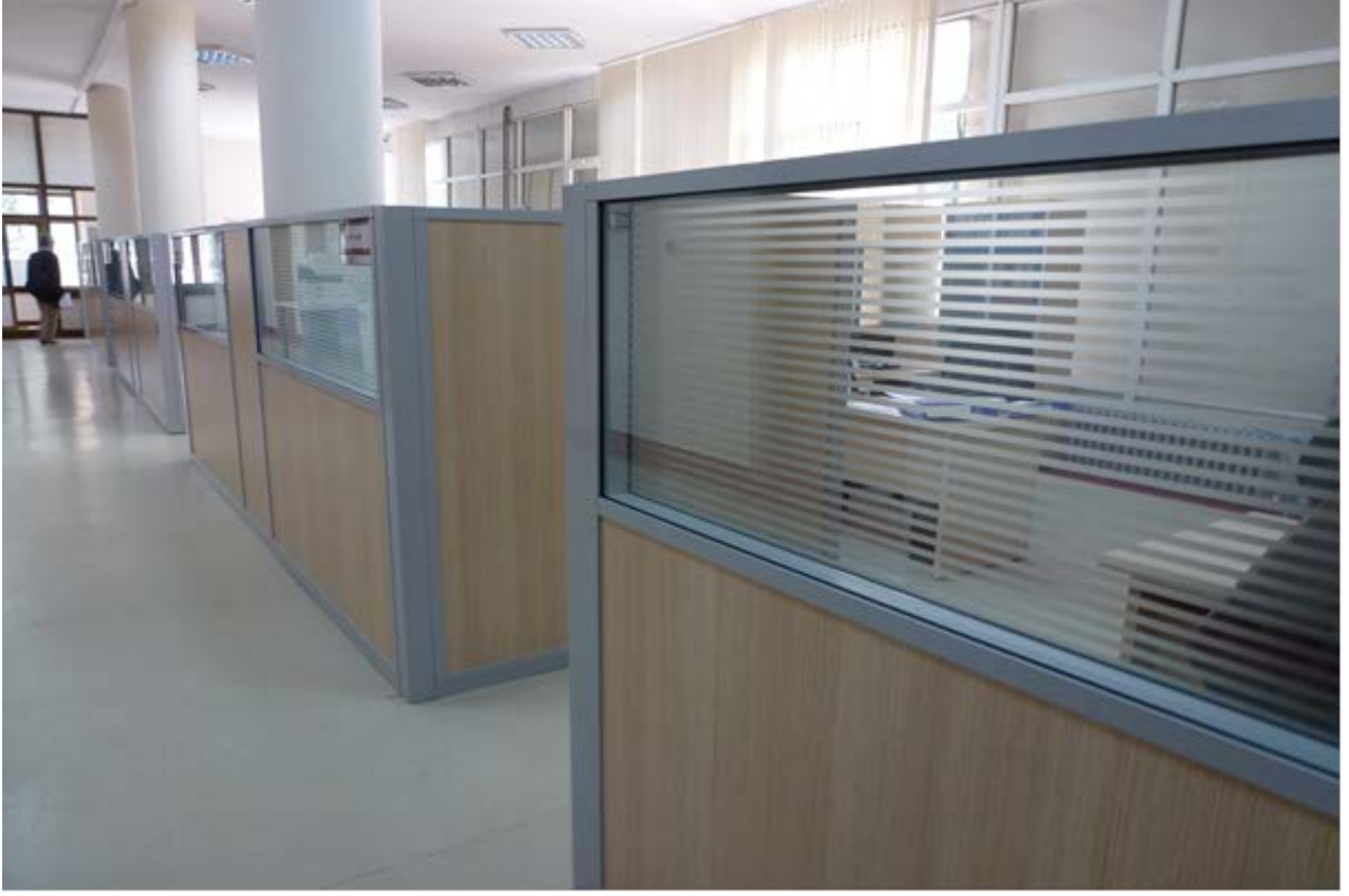
Göztepe binası birinci kata ofis bölme sistemi yapılması: